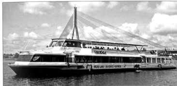
Statek wycieczkowy na Dźwinie.