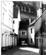
Zaułek nieopodal placu Ratuszowego.